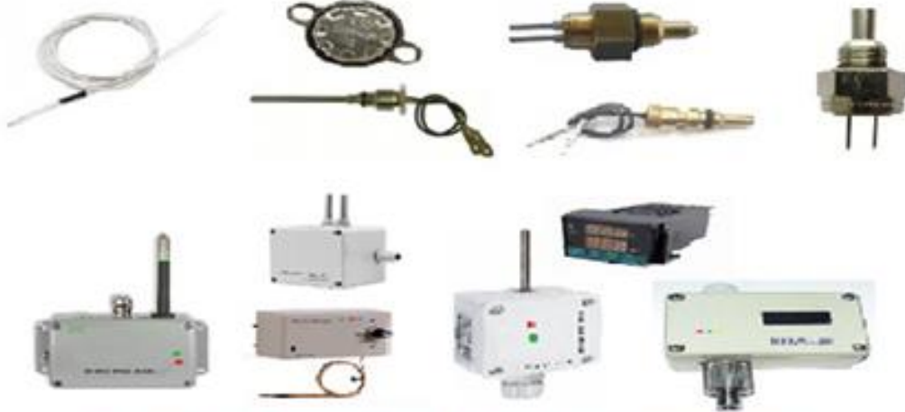
Isı , Sıcaklık ve Nem sensörleri , İndikatörleri ve kontrol sistemleri

İklimlendirme kontrol sistemlerinin Mekanik otomasyonunda temel amaç iklimlendirme ve tesisat düşünülerek tasarlanıp konulmuş mekanik cihazlara otomatik çalışma fonksiyonu kazandırmak ve merkezden izleme/kontrol yapılmasını sağlamaktadır